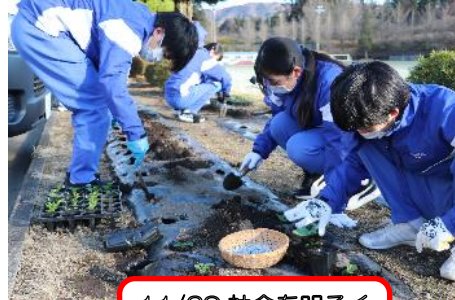
11/29 社会を明るく する運動表彰