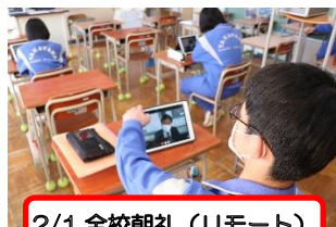
2/1 全校朝礼(リモート)