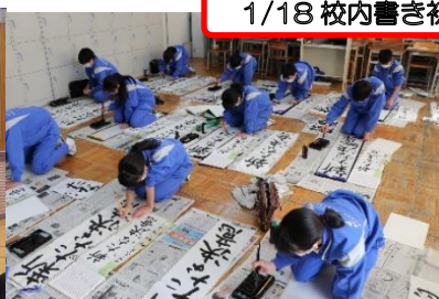
1/18 校内書き初め大会(1年生)