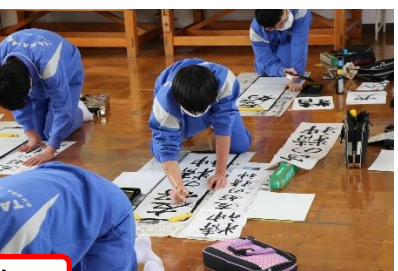
1/18 校内書き初め大会(2・3年生)