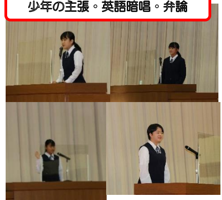
少年の主張・英語暗唱・弁論