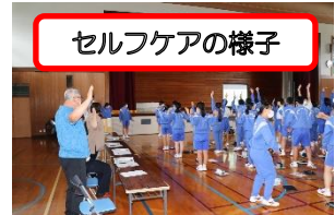
セルフケアの様子