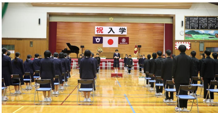
【新入生代表の言葉】

合わせて高山中学校71名の生徒全員のより高い目標実現のために、今後とも暖かい支援とご協力をお願いいたします。